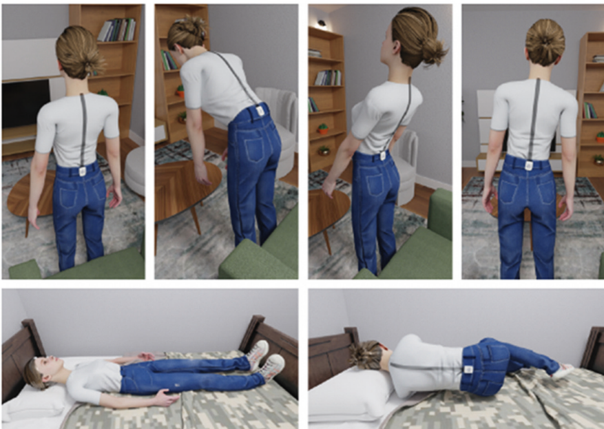
Abb. 1: Messtechnik des Wirbelsäulensensors (eigene Darstellung).

Die Anwendungsbeispiele des Zukunftslabors Gesundheit decken dabei eine große Bandbreite an Sensortechnologien ab, um Unternehmen breit und technikneutral beraten zu können.