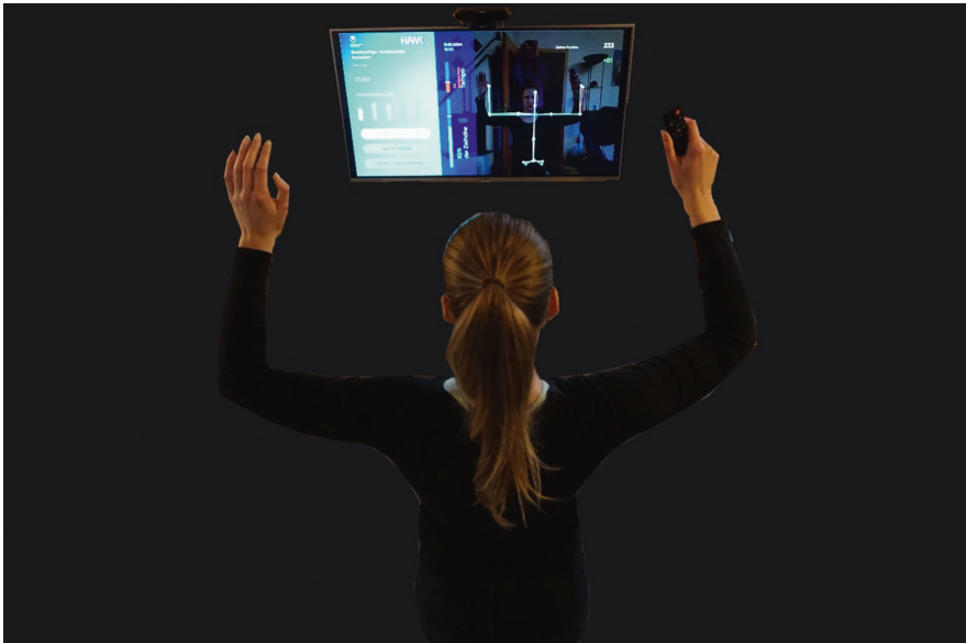
Abb. 2: Die Physio-App (Demonstrator) (eigene Darstellung).

Neben den Online-Kursen, deren primäres Ziel die Wissensvermittlung ist, entwickelt das Zukunftslabor Gesundheit prototypisch für den Bereich der mobilen telemedizinischen Therapieunterstützung eine Physiotherapie-App für die Rehabilitation nach Schulteroperationen. Patient*innen können mit der App Übungen im häuslichen Umfeld erlernen und durchführen. Die behandelnden Therapeut*innen wählen zunächst Übungen und Anzahl der Wiederholungen für ihre Patient*innen aus und konfigurieren die App über eine Webschnittstelle, die sie auch mit personalisierten Hinweisen zu den Übungen versehen können. Die Patient*innen schalten zu Hause eine Kamera ein, die mit einem Bildschirm und der App gekoppelt ist. Die Kamera erfasst die Bewegungen der Patient*innen, dabei kommt der Algorithmus zur kamerabasierten Erkennung der Körper-